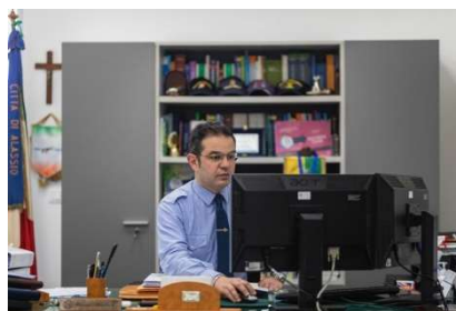
Francesco Parrella, Comandante

A livello di gestione del personale tuttavia, e nonostante tutto, sono stati 6 i corsi di aggiornamento a cui hanno potuto partecipare alcuni operatori del Corpo, oltre al corso di prima formazione della durata di 6 mesi al quale ha partecipato un agente neoassunto. Il personale, sempre in carenza di organico ma anagraficamente rinnovato da un turnover che ha fatto scendere l'età media ai 46 anni, ha poi svolto nel periodo estivo 372 ore di servizio in pattuglie balneari, al fine di arginare il fenomeno del commercio ambulante abusivo e controllare la disciplina vigente in materia di contrasto alla diffusione del virus. E proprio in tema di lotta al Covid-19 emergono i 404 turni di servizio in cui il Comando è stato impiegato in dispositivi di Ordine Pubblico alle dipendenze dell'Autorità Provinciale di Pubblica Sicurezza.