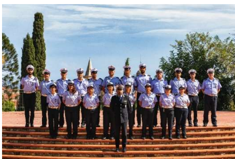
Foto di gruppo del Comando di Polizia Municipale (settembre 2020)

Quello di essere tra la gente ed a disposizione di tutti, secondo gli indirizzi dettati dall'Amministrazione, è il nostro lavoro. Continueremo a farlo con dedizione e passione, con impegno e attenzione, consapevoli della fortuna che abbiamo a svolgere un servizio il più possibile dedicato alla comunità alassina, formata dai residenti ma anche dai tanti turisti che speriamo possano tornare presto ad affollare le vie e le spiagge della nostra straordinaria città. Noi saremo sempre qua, come ci piace dire, al servizio di Alassio.