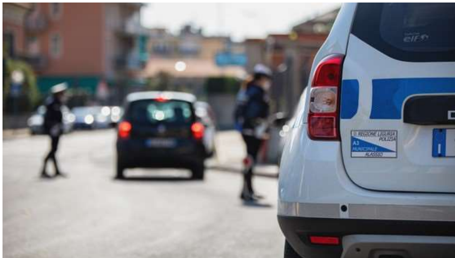
Controlli su strada relativi alla disciplina Covid-19